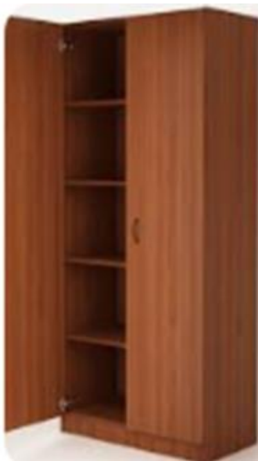
Ясень шимо светлый