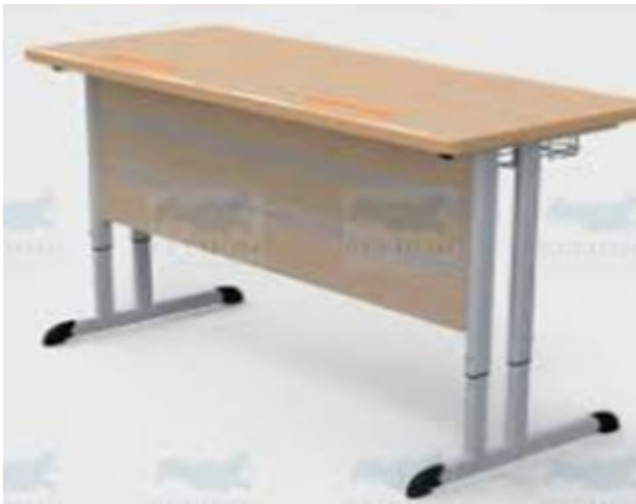
Ясень шимо светлый