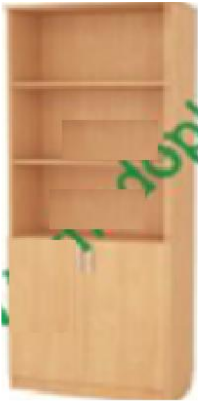
Ясень шимо светлый