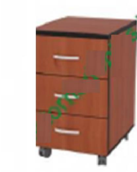
Ясень шимо светлый